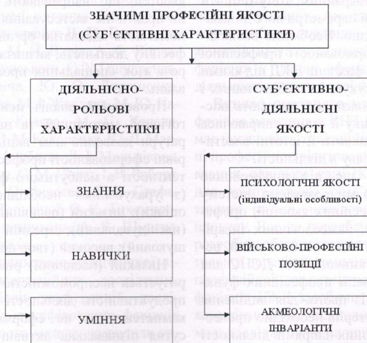
Рис. 1. Значимі професійні якості випускника ВNZ ДSHS

Середній рівень (активно-пошуковий) характеризується спроможністю забезпечити відносно високу продуктивність праці. Для курсантів характерні відповідні переконання, необхідні знання, практичні вміння й навички, що дозволяють грамотно виконувати різноманітну навчальну й службову діяльність під контролем і при консультативній допомозі викладачів і досвідчених товаришів. Цей рівень відрізняється погодженістю в проявах думок, почуттів, поведінки, але ця погодженість не повністю гармонічна. У цьому проявляється недостатня розвиненість самостійності (суб'єктивності). Пізнавальна активність проявляється в освоєнні науково-популярної літератури та інформаційних технологій. Більшість курсан-