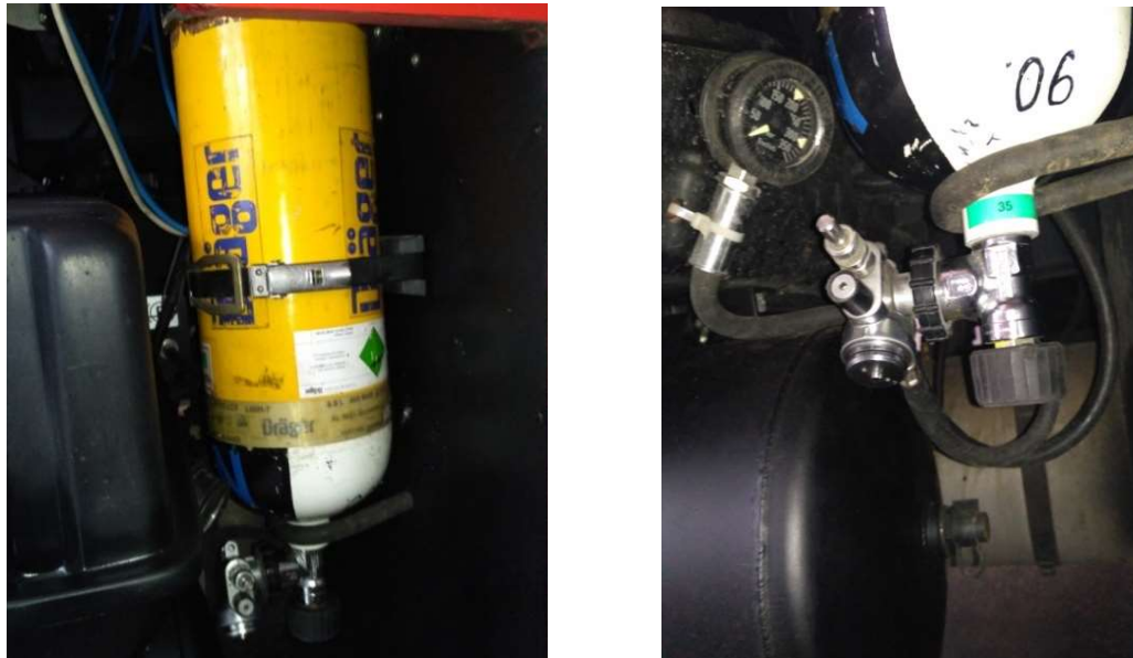
Рис.2. Розміщення повітряного балону зі стисненим повітрям на АЦ – 4 – 60 (5309) – 505М

З огляду на окреслену проблему авторами запропоновано змінити місце розташування повітряного балону системи розгальмування АЦ – 4 – 60 (5309) – 505М не змінюючи конструкцію пневмосистеми. Для цього пропонується використати балон з дихального апарату на стисненому повітрі, що широко використовуються підрозділами ДСНС України рис.2.