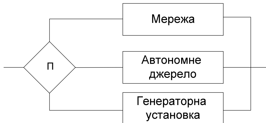
Рисунок 1 – Логічна схема активного резервування електроживлення

Ефективність комбінованого способу резервування підтверджує підвищення параметру ймовірності безвідмовної роботи системи з автономним джерелом від акумуляторних батарей на відміну від систем які використовують тільки генеруючі установки.