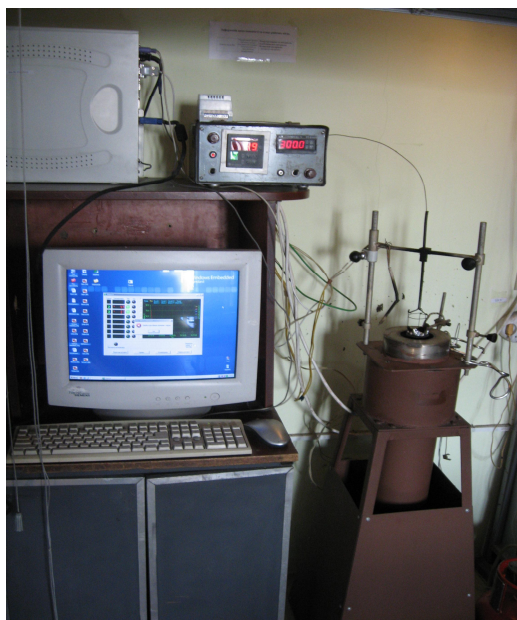
Рисунок 1 – Пристрій ОТП, ПК, термоперетворювач ТХА – хромель-алюмель

Прилади і методи. У ході проведення досліджень використано лабораторні ваги ТВЕ 150, прилад ОТП, секундомір лабораторний. Температуру займання визначали за допомогою термоперетворювача ТХА – хромель-алюмель згідно з ДСТУ Б В.2.7-19-95, а час до займання – секундоміром від початку дослідження температури займання до моменту займання.