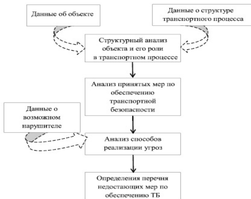
Рисунок 1 – Объект транспортной безопасности

Заключение. Обеспечение безопасности транспортного комплекса является важнейшей составляющей национальной безопасности, отражающей состояние защищенности жизненно важных интересов личности, общества и государства от внешних и внутренних угроз в транспортном комплексе. Даже малейший сбой в работе транспортного комплекса может обернуться для государства колоссальными потерями: материальными, людскими, экологическими, технологическими. Поэтому транспортные средства отнесены к категории источников повышенной опасности, а вся транспортная система определяется как система высокорисковых объектов.