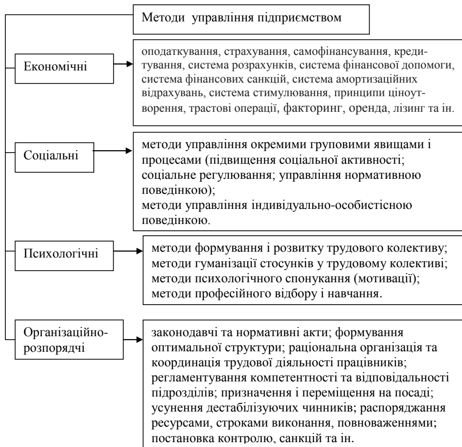
Рис. 3. Класифікація методів управління в системі економічного механізму підприємства *