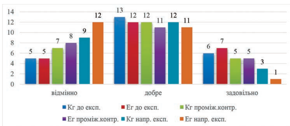
Рис. 3. Динаміка формування практичних навичок застосування заходів фізичного впливу (сили) досліджуваних курсантів Кг та Ег протягом педагогічного експерименту

Таким чином, враховуючи результати педагогічного експерименту, членами науково-дослідної групи було підтверджено ефективність розробленої прикладної ментальної карти (рис. 1), що забезпечує готовність майбутніх офіцерів Національної поліції України до застосування заходів фізичного впливу в різних умовах службово-оперативної (бойової) діяльності та свідчить про удосконалення їхньої професійної (службової) підготовленості.