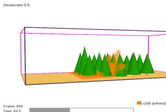
Рис. 1 Візуалізація результатів моделювання пожежі в соснових насадженнях у молодому віці в середовищі WFDS

Для моделювання пожежі у WFDS на основі проведеного нами експериментального дослідження у польових умовах деякі значення параметрів взято згідно з [3]. Візуалізація результатів роботи моделі зображена на рис. 1.