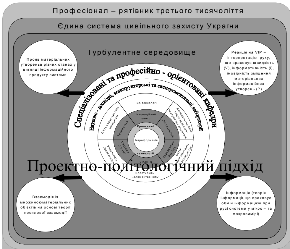
Рис. 2. Модель-схема освітнього проектного середовища формування професіонала-рятівника третього тисячоліття в турбулентному середовищі на основі використання теорії несилової взаємодії, інформації та Sh- технологій

Модель-схема освітнього проектного середовища підготовки рятівника III-го тисячоліття представлена на рис. 2.